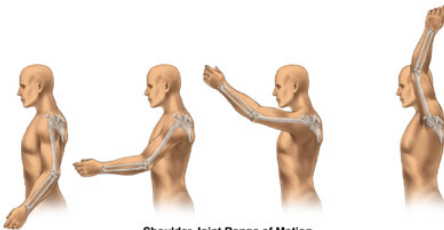
Shoulder Joint Range of Motion