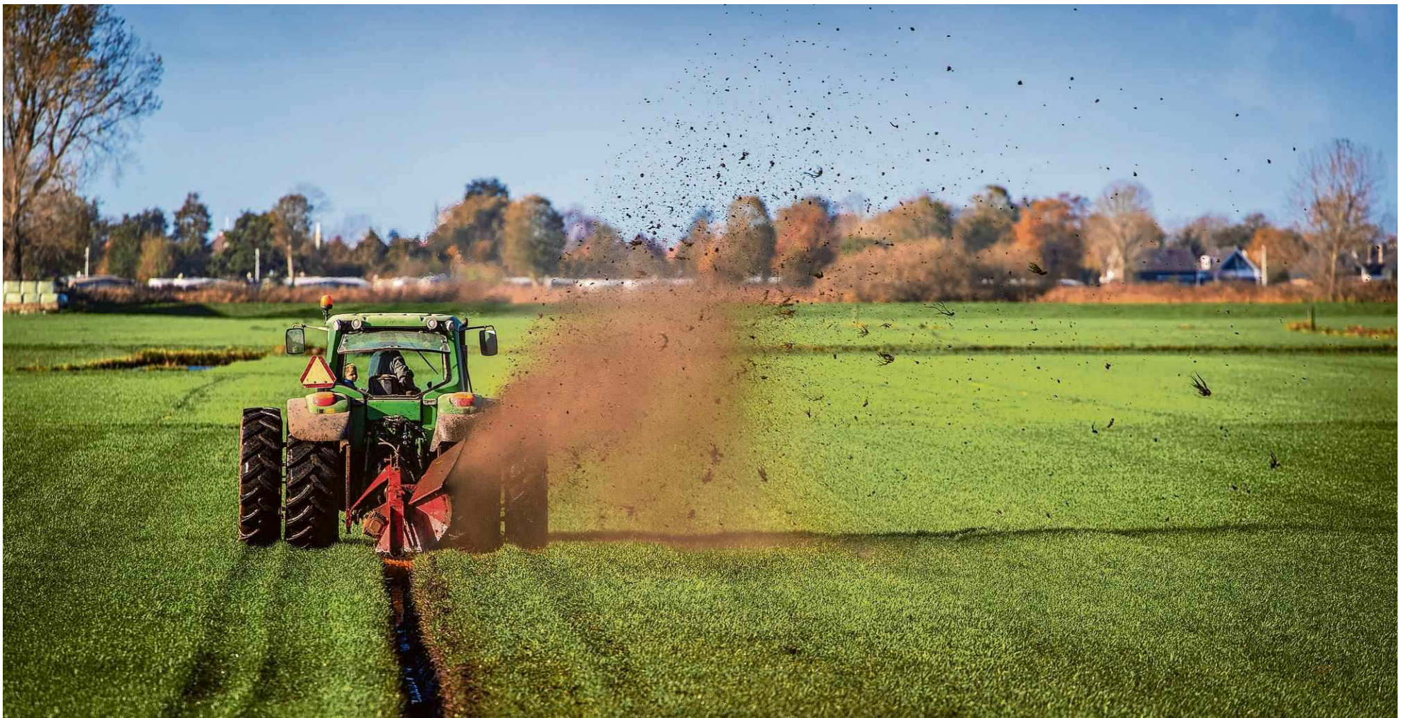
Bij Woudsend is een veehouder bezig met het frezen van de greppels. Hiermee zorgt hij ervoor dat het regenwater op zijn land beter naar de sloot kan wegvloeien. Het opnieuw frezen van de greppels is een klus die vaak in het najaar wordt uitgevoerd. Om te voorkomen dat de trekker diep wegzakt, zijn er twee paar achterbanden gemonteerd.